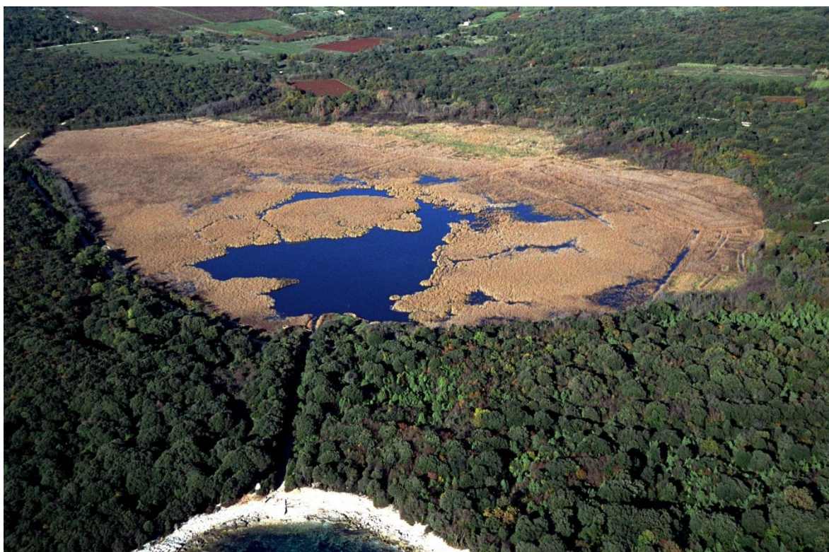
Palud iz zraka

Unutar granica rezervata, nalaze se i vrijedna arheološka i povijesna nalazišta, a na samoj obali mora vidljivi su i ihnofosili (ostaci stopa dinosaura).