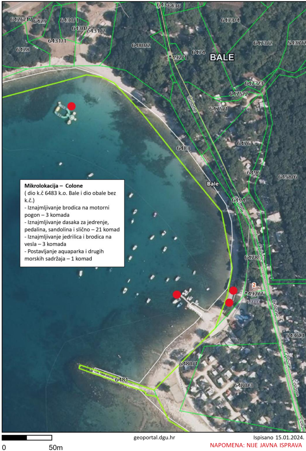
Prilog 2 – mikrolokacija uvala Colone (unutar PPR Datule – Barbariga)